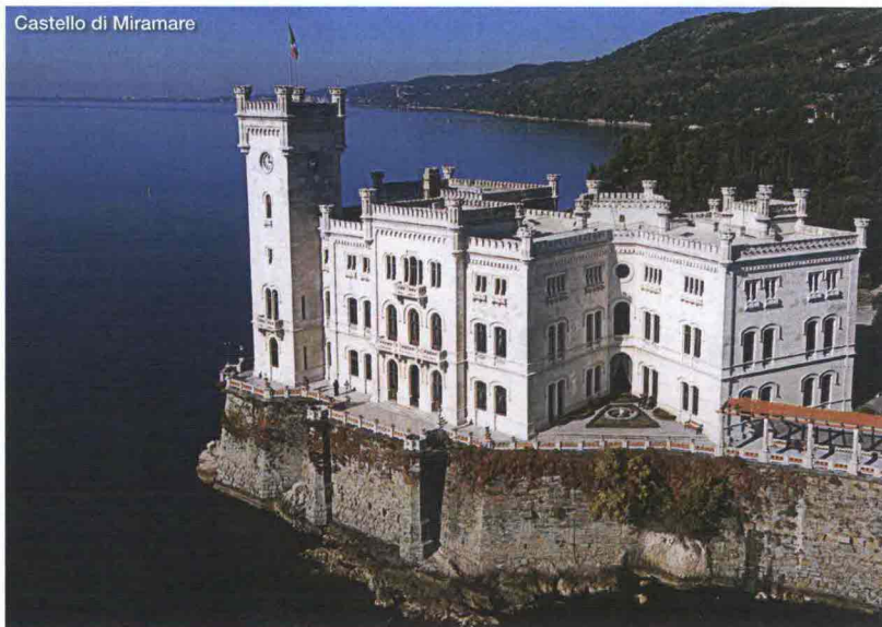
Castello di Miramare