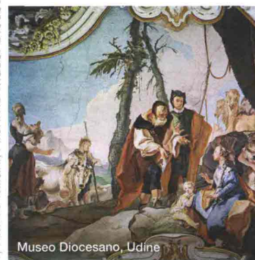
Museo Diocesano, Udine