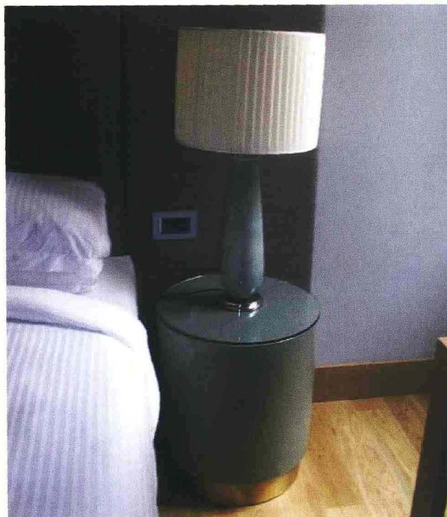
PARTICOLARI DELLE CAMERE DELLO STARHOTELS ROSA DI MILANO.

Le camere del Bentley di Genova e quelle dello Starhotels Rosa di Milano in stile decisamente contemporaneo: ecco due recenti progetti realizzati da Ceccotti Interior Hotel Design, che esprimono la capacità di spaziare da uno stile all'altro dell'azienda toscana che, con oltre cinquant'anni di esperienza e più di 500 realizzazioni in Italia e all'estero, è sinonimo di arredamenti per alberghi di lusso. Specializzatasi nella formula del "chiavi in mano" infatti, Ceccotti ha da sempre puntato sulla qualità di materiali e finiture, sul design e sulla cura del particolare, oltre che sulla professionalità e l'affidabilità del servizio.