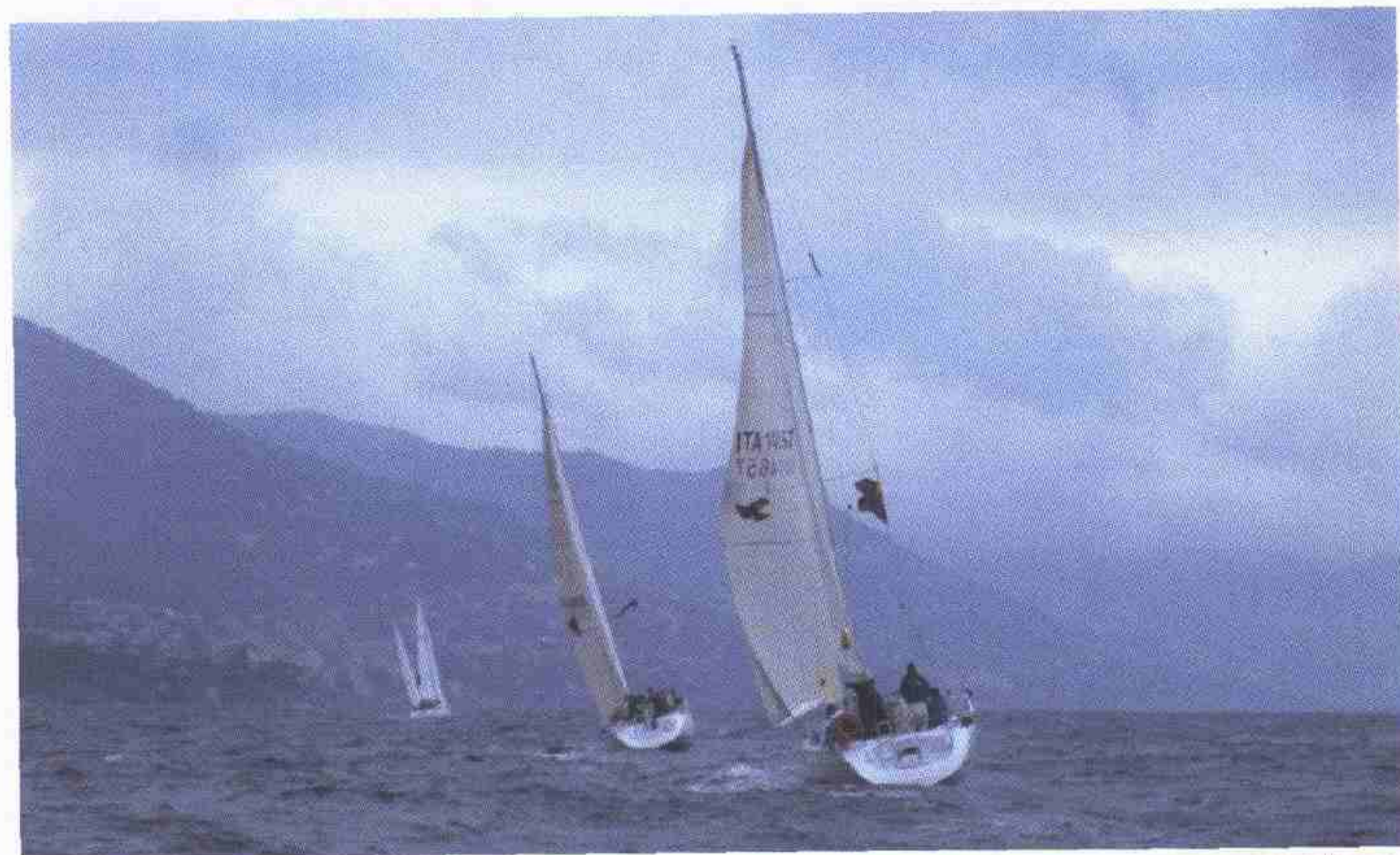
In alto, momenti di tensione per le barche in competizione tra il vento a venti nodi e il mare forza 5.