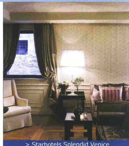
&gt; Starhotels Splendid Venice

Innovazioni tra lo sportivo e il tecnologico in casa Starhotels , catena che ha introdotto in tutti i suoi alberghi le console Wii Fit e Wii Sports Nintendo. I due "personal trainers" virtuali consentono di fare attività fisica nella propria camera, dallo yoga all'aerobica, dal tennis al ping pong, visualizzando le indicazioni e le attività sullo schermo della tv e monitorando le performance grazie ai sensori collegati in wireless con la console. E questo è solo un tassello della strategia di rinnovamento del gruppo, che ha di recente inaugurato un nuovo albergo nel cuore di Venezia, lo Starhotels Splendid Venice.