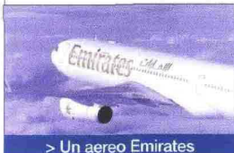
> Un aereo Emirates

Dubai-Londra Emirates introduce una grande novità: l'A380, il gigantesco aereo a due piani. I posti disponibili sul volo giornaliero sono 489, il 40% in più rispetto al Boeing 777. Dal prossimo febbraio l'A380 verrà introdotto anche sulle tratte Dubai-Sydney e Dubai-Auckland.