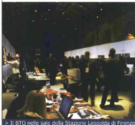
> Il BTO nelle sale della Stazione Leopolda di Firenze

Si è conclusa con un bilancio più che positivo la prima edizione di BTO Buy Tourism Online , l'evento che si è svolto presso la Stazione Leopolda di Firenze il 17 e 18 novembre. Organizzato con la collaborazione di Regione Toscana, Toscana Promozione, Apt, associazione albergatori, Comune, Provincia, Camera di Commercio di