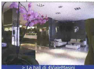
> La hall di 4VialeMasini

soggiorno a prezzo speciale. In collaborazione con il Teatro Europa Auditorium di Bologna, il pacchetto per due persone in executive suite a 150 euro comprende una notte, cena gourmet nel 4UBar&Bistrot, il ristorante dell'albergo, e due biglietti in prima fila per uno spettacolo a scelta su www.teatroeuropa.it , mentre a partire da 125 euro lo stesso pacchetto è disponibile con soggiorno in camera superior.