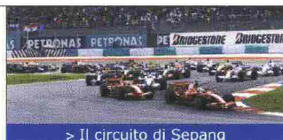
&gt; Il circuito di Sepang

La passione per la velocità e per le più famose gare di Formula 1 e Moto GP portano sempre più lontano, fino alle spiagge della Malaysia . Il circuito automobilistico di Sepang ospiterà infatti numerosi eventi durante l'anno, dal classico Gran Premio di Formula 1 della Malaysia (3-5 aprile 2009) al Moto Gp (23-25 ottobre 2009), fino a prove di endurance, motocross e auto sportive. Il circuito, al cui interno sorge anche un faraonico centro commerciale, è dotato di aree Vip e lounge, privatizzabili per eventi