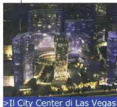
&gt; Il City Center di Las Vegas

Proseguono i piani di espansione di Las Vegas, che se annualmente accoglie 39,2 milioni di visitatori, si è posta come obiettivo per il 2010 la cifra record di 43 milioni di presenze. Con un investimento di 32 miliardi di dollari, la capitale del divertimento amplia la ricettività, il cui fiore all'occhiello sarà l'imponente City Center , un'area di 271.000 mq compresa tra il Bellagio e il Monte Carlo Resort. La Vertical City verrà realizzata da MGM Mirage e Dubai World entro la fine del 2009, con un investimento di nove miliardi di dollari, e comprenderà quattro alberghi, per un totale di 1.000 camere. Oltre ai pernottamenti, il City Center offrirà molti divertimenti, con ARIA, il resort casinò di 61 piani (e circa 10.000 mq di spazi per congressi) e The Crystals, uno shopping center di 45.000 mq.