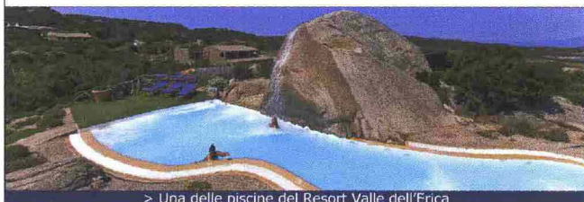
> Una delle piscine del Resort Valle dell'Erika

Il 2009 è l'anno in cui Delphina Hotels & Resorts lancia un nuovo, pressoché inedito connubio: quello fra i trattamenti benessere e la cucina gourmet. Succede al Thalasso & Spa "Le Thermae" del cinque stelle Resort Valle dell'Erika , uno dei sette hotel del gruppo sardo affacciato sul mare a nord di Palau. Nel centro benessere specializzato in trattamenti talassoterapici, ai bordi delle piscine mimetizzate tra le rocce di granito, è possibile godersi un raffinato aperitivo unito a un massaggio rilassante. Ma anche trattenersi per una cena a lume di candela con un menu d'alta cucina, ideato appositamente dagli chef dell'hotel.