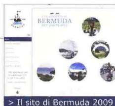
&gt; Il sito di Bermuda 2009

anni dalla scoperta, come anticipa il Bermuda Tourism Italy . «Abbiamo creato anche un sito ad hoc, www.bermuda2009.bm , ricco di informazioni» spiega Ewart F. Brown, Premier e ministro del Turismo e dei Trasporti di Bermuda, «per dimostrare come il 2009 sia l'anno