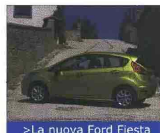
&gt; La nuova Ford Fiesta

Ormai si può dire che la General Motors è di casa a Borgo la Bagnai . La multinazionale automobilistica americana infatti ha scelto la struttura nella campagna toscana anche nel 2008 per presentare una sua macchina, la nuova Ford Fiesta, alla presenza di 1.200 giornalisti. Un ritorno alla grande, dopo che nel 2004 era stata protagonista