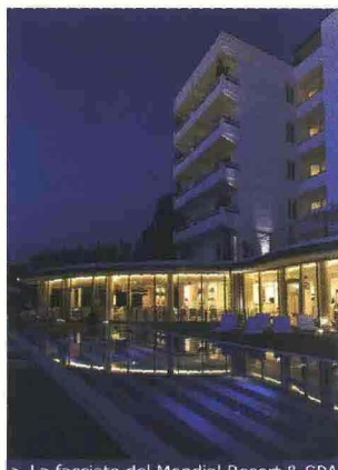
> La facciata del Mondial Resort & SPA

A disposizione degli ospiti e dei clienti esterni il ristorante Blanco, in cui gustare il meglio della saporita gastronomia toscana.