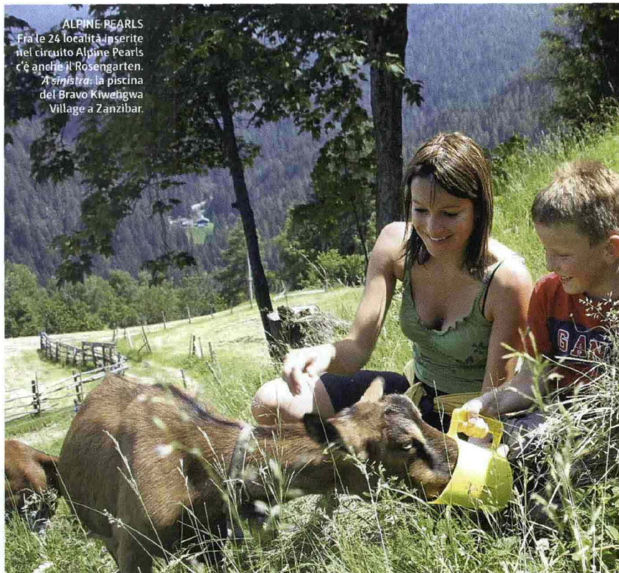
ALPINE PEARLS Fra le 24 località inserite nel circuito Alpine Pearls c'è anche il Rosengarten. A sinistra: la piscina del Bravo Kwehigwa Village a Zanzibar.

a 2 anni, e soggiorno gratis da 2 a 4 anni. Fino a 18 anni, la riduzione è invece del 60%. Nei Villaggi Magic Valtur si viaggia free fino alla maggiore età in camera con 1 o 2 adulti. Il gruppo Turisanda , TClub , Hotelplan garantisce la gratuità